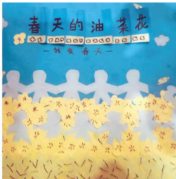
小记者:姚婧琪 商水县直第二小学五(5)班 辅导老师:王芳