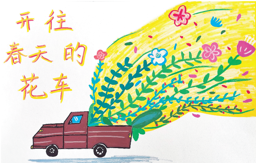
小记者:徐暖 周口市纺织路小学一(3)班 辅导老师:徐梦琪