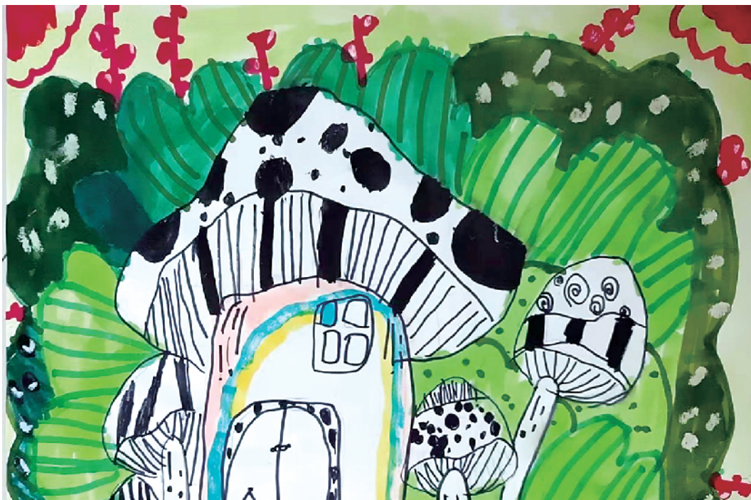
小记者:王亦凡 周口市实验学校一(1)班 辅导老师:任艳春