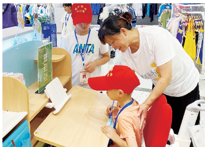
工作人员为小记者介绍营业员工作。