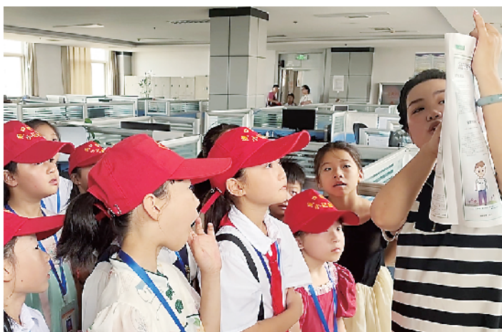
编辑老师为小记者介绍报纸版面。