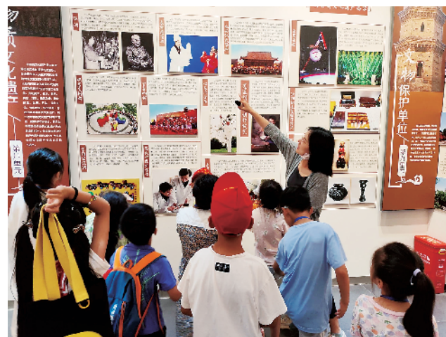
小记者聚精会神地听老师介绍周口的历史。

●7月13日,70余名小记者到周口方志馆参观学习。工作人员为小记者讲解周口的历史,让小记者感受家乡的繁荣与变迁,更好地弘扬和传承属于周口的地方文化。