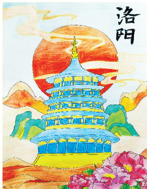
小记者:柳辰灏 六(4)班 辅导老师:王敏杰

忙碌并不意味着疲倦,相反,它给我们带来了满满的成就感和幸福感。在忙碌中,我学会了分配时间,学会了承担责任,也学会了珍惜与家人相处的时光。