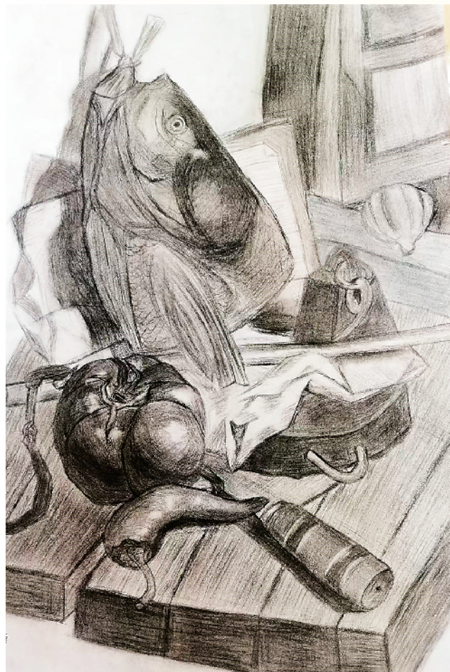
小记者:赵晨语 六(4)班 辅导老师:王敏杰