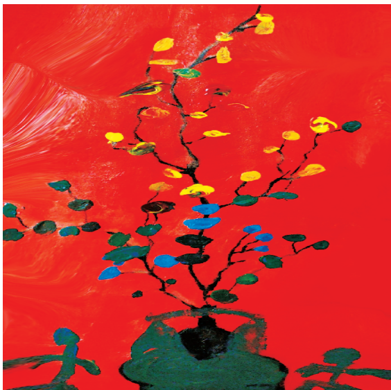
小记者:张肖君 周口市莲花路小学一(5)班 辅导老师:郑慧敏