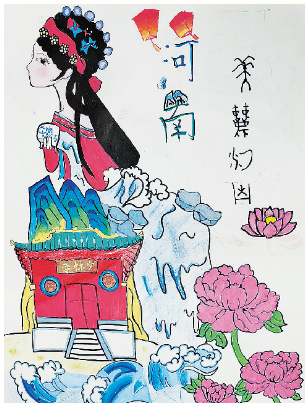
小记者：张栩 二(3)班 辅导老师：张可欣