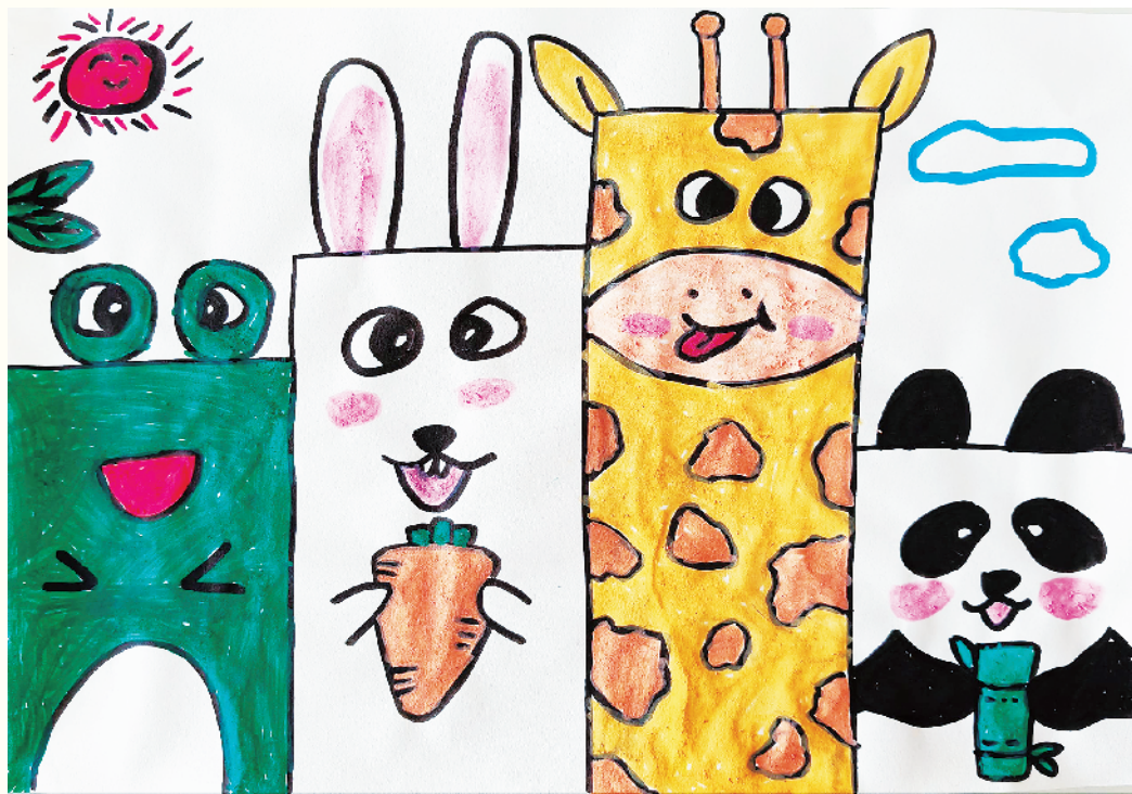
小记者：赵家琦 一(5)班 辅导老师：耿盼