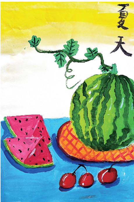
小记者:赵科旭 周口市纺织路小学四(7)班 辅导老师:陈静静