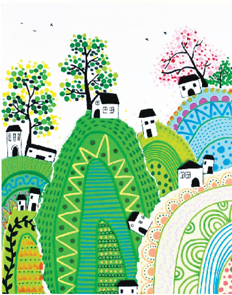
小记者:李梓源 周口市六一路小学四(4)班 辅导老师:郑涵