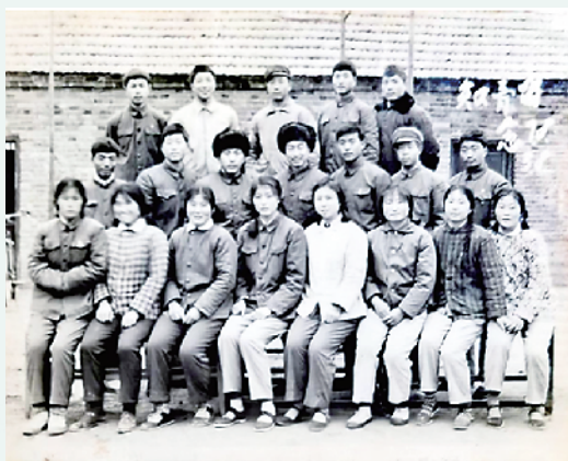
1976 年,扶沟高河套村部分知青合影留念(资料图)。

盛夏七月,烈日炎炎,却抑制不住扶沟知青 50 年后再聚高河套知青点的热情。2025 年 7 月 12 日,正午刚过,18 位在高河套村“滚一身泥巴,练一颗红心”的知青代表驱车来到他们当年住过的知青大院旧址,在仅存的 8 间房屋前,追忆当年的风华岁月。