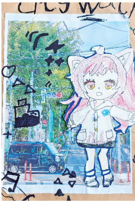
小记者:李翊含 二(6)班 辅导老师:刘芝勤