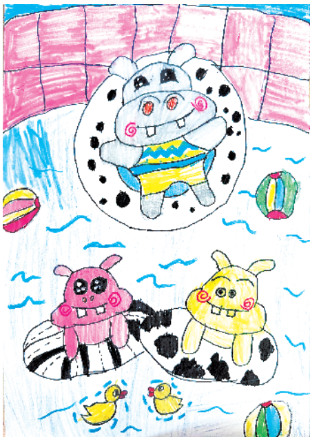
小记者:王小暖 一(7)班 辅导老师:刘春宇