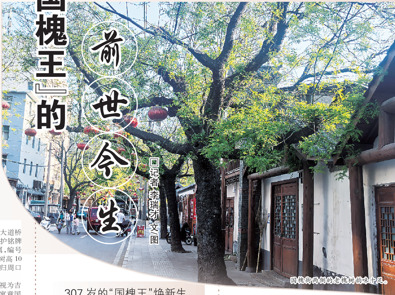
国槐街两侧的老槐树韵味十足。