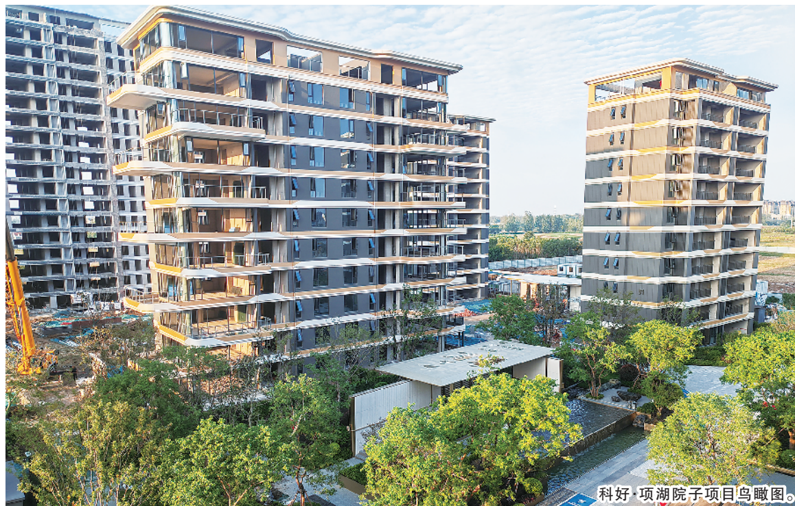
科好·项湖院子项目鸟瞰图。