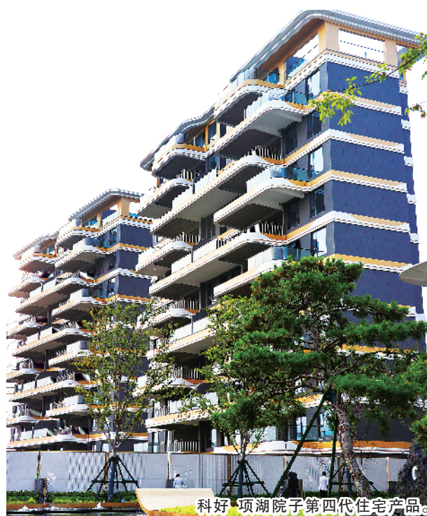
科好·项湖院子第四代住宅产品。