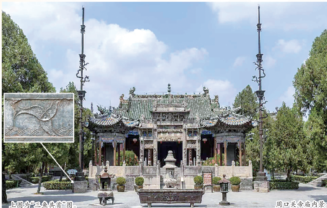
上图即为“三鱼共首”图。