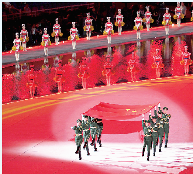
11月9日，旗手护送中华人民共和国国旗入场。当日，第十五届全国运动会开幕式在广东奥林匹克体育中心举行。