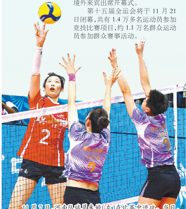
11月7日，河南队球员朱婷（左）在比赛中进攻。当日，在澳门举行的第十五届全国运动会排球女子成年组小组赛A组比赛中，河南队3比0战胜天津队。