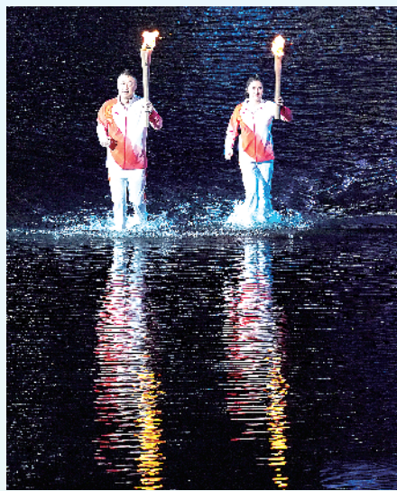
11月9日，火炬手马琳（左）和陈若琳传递火炬。当日，第十五届全国运动会开幕式在广东奥林匹克体育中心举行。