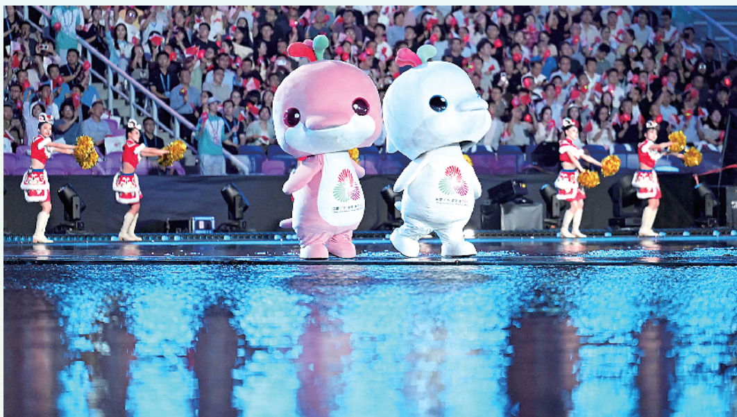
11月9日，第十五届全国运动会吉祥物“喜洋洋”和“乐融融”在开幕式现场表演。当日，第十五届全国运动会开幕式在广东奥林匹克体育中心举行。