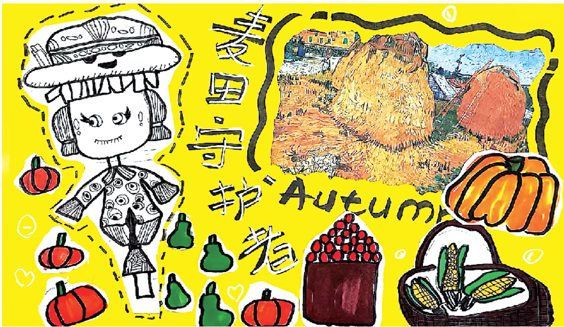
小记者:康梓柔 二(1)班 辅导老师:白璐