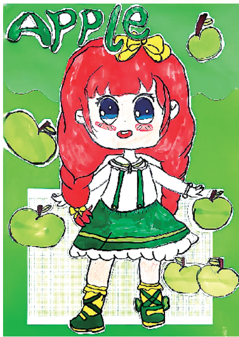
小记者:张霖熙 二(2)班 辅导老师:吴春玉