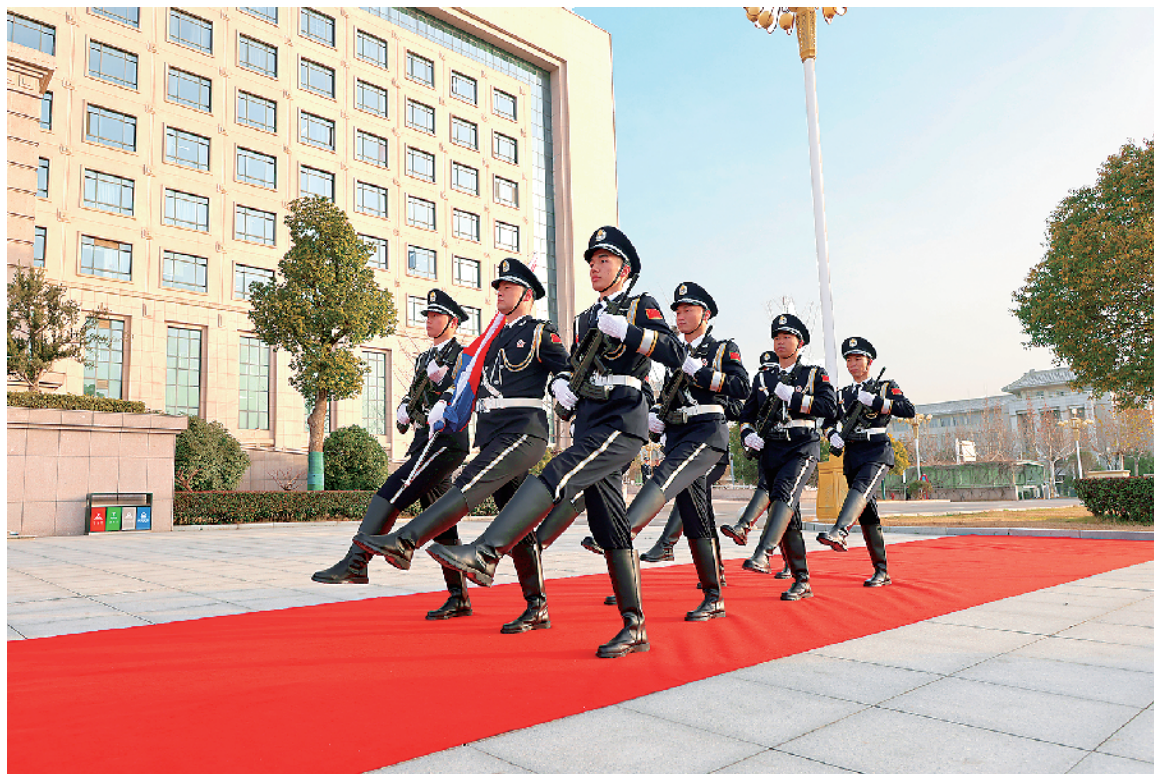
警歌嘹亮，警旗飘扬。1月10日，我市隆重举行庆祝第六个中国人民警察节活动。周口公安通过升警旗、唱警歌、重温入警誓词等系列活动庆祝节日，彰显忠诚担当。