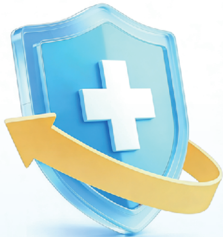
本版图片由 AI 生成。

在目标设定上,更是坚持稳扎稳打、循序渐进,明确医改各项指标每年稳步提升,把有限的医疗资源精准投放到群众最需要的地方,让医改成效真正转化为群众可感可及的健康实惠。