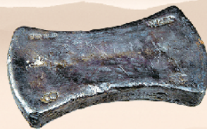
项城出土的元代银锭。