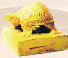
西华出土的西汉金印。