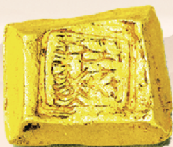
淮阳出土的楚国金版“陈爱”。