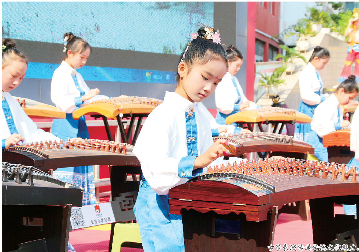
古筝表演传递传统文化魅力。

各校的主题班会形式多样，红色故事宣讲、趣味游戏、暖心分享轮番上演，孩子们在轻松愉悦的氛围里收获快乐，欢度属于自己的节日。