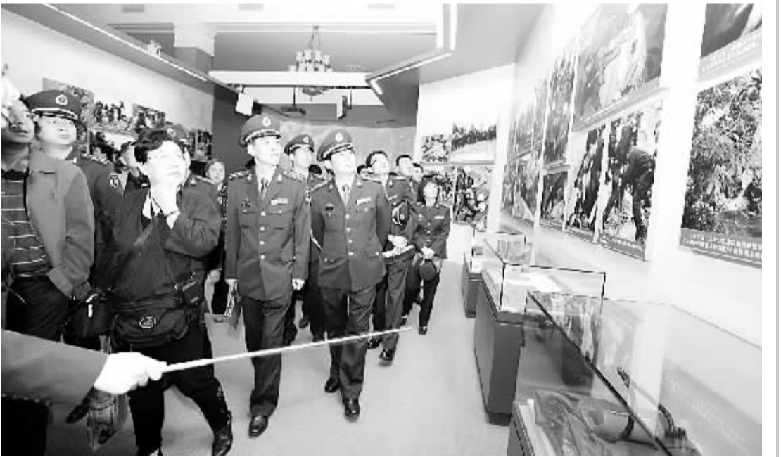
安理会呼吁各国积极参与打击索马里海盗行为 10月7日,在美国纽约联合国总部,安理会本月轮值主席、中国常驻联合国代表张业遂主持商讨打击索马里海盗行为的会议。