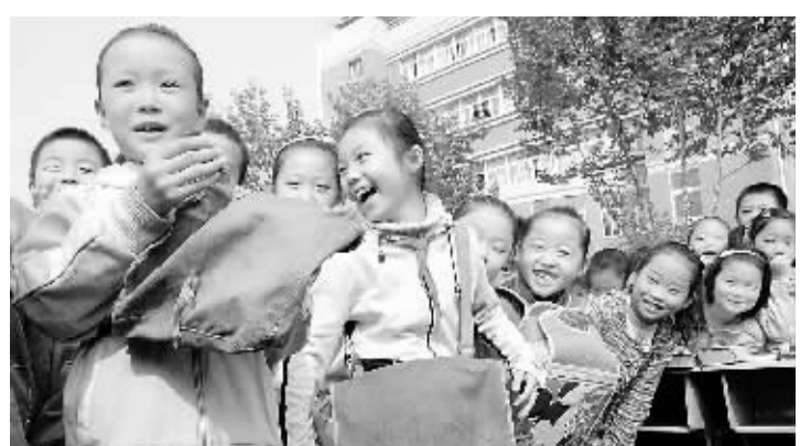
学习用具看变化 10月7日,在安徽淮南市田家庵区洞山第二小学,学生们展示父母背过的布书包。当日,洞山第二小学举行“学习用具看变化”实物展,同学们将父母上学时用过的学习用品和自己的学习用具进行对比展示,感受生活的日新月异。

各项救援工作顺利进行。西藏自治区副主席官蒲光介绍,这次地震受灾较重的是当雄县格达乡和尼木县迈远乡。根据西藏自治区地震局提供的资料,从6日16时30分到7日10时共发生余震211次,其中,6级以上地震一次,5级以上地震一次。