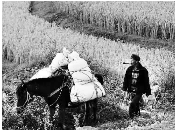
秋粮归仓 10月7日,贵阳市花溪区高坡乡大洪村农民运送刚收割的稻谷回家。眼下贵阳已进入秋粮收割高峰期,农民们正利用好天气加紧抢收稻谷,颗粒归仓。

相关背景显示,这是央行近9年来下调所有存款类金融机构人民币存款准备金率;存贷款基准利率双双下调的举措也为近年来罕见。