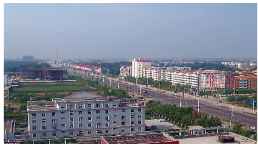
沈丘县高楼林立的新区街道。

游园区进行全面建设。天然气入户工程建设、污水管网建设、城区自来水沙南供水厂建设等基础设施相继完工。同时,该县以创建文明城市、卫生城市为载体,对小街小巷进行了硬化、亮化、绿化、净化的“四化”工程。建立健全了县城管理长效机制,城市品位明显提升。 ——坚持建管并重,协调发展。在城市规划建设过程中,“三分建,七分管”,该县清楚地认识到管理的重要性,在规划之初就充分考虑了管理办法,对城区内的电话亭、报刊亭、洗车点、露天夜市摊点及灯箱广告牌都进行了统一规划,合理布局,对不符合规划的建设行为进行了严厉惩治。 一分耕耘,一分收获。经过近年来的艰辛努力,如今的沈丘县县城交通通畅,市容整洁,一个新兴的现代化都市正在崛起。