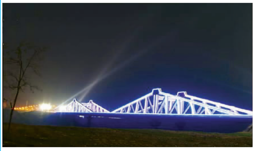
夜幕下,流光溢彩的沈丘县沙颍河大桥分外妖娆。

明弘治十年复置沈丘县至今。 该县位于河南省东南边沿,地处颍水中游,县境西邻项城市,西北及北部接淮阳县、郸城县,东南与安徽省界首市、临泉县毗连。该县县城位于县西部边沿,依沙颍河而居,水陆交通畅通。沈丘大桥横跨沙颍河,是豫东穿越沙颍河必经之道。该县是豫东南的交通枢纽,是河南的东大门。特殊的地理位置促进了该县的发展,水陆并举,商贾云集,经济发展一片繁荣,早在上世纪70年代,就被称为是周口的“小上海”。 经济的迅猛发展,使本来并不完善的城市基础设施不能满足群众的需求,科学规划城区发展迫在眉睫——