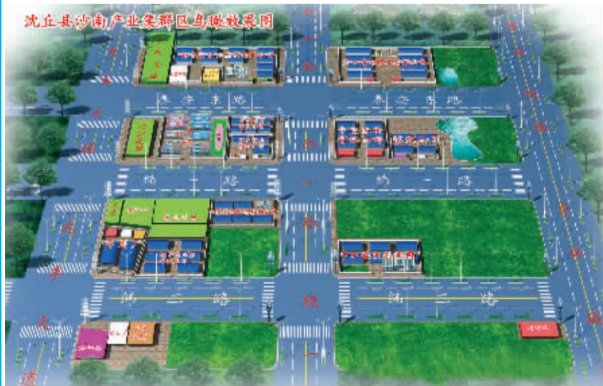
沈丘县沙南产业集聚区鸟瞰效果图。