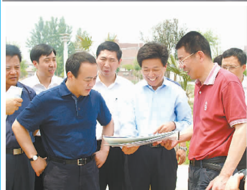
市委书记毛超峰在沈丘县县委书记王云彪陪同下视察该县城市建设。

近年来,沈丘县以基础设施建设为前提,以建设、经营城市为重点,以特色文化为内涵,以产业发展为支撑,逐步推进县城现代化,集镇城市化,城乡一体化,建管规范化,朝着县级市发展方向迈进,沈丘逐渐成为豫东地区一颗耀眼的“明珠”。 沈丘县城每天都在变化,一个个豪华住宅小区相继竣工,一个个工业项目相继落地。建设工地上机械轰鸣,热闹非凡;商业街内商品琳琅满目,商贾云集;机关里人来人往,忙而不乱,秩序井然…… 漫步沈丘县城,处处是绿色,处处是公园,街道在加宽,高楼连片起;听到的是文明用语,看到的是文明行为…… 如今的沈丘新城道路宽阔,街道整洁,一路两旁栽种着各种树木,有婆娑依依的垂柳,枝繁叶茂的梧桐,绿化带里的常青灌木丛绿意盎然。每当夜幕降临,一盏盏美观大方的华灯齐放,将夜色下的新城区装扮得更加绚丽多彩。 城市的基础建设和功能得到了完善;