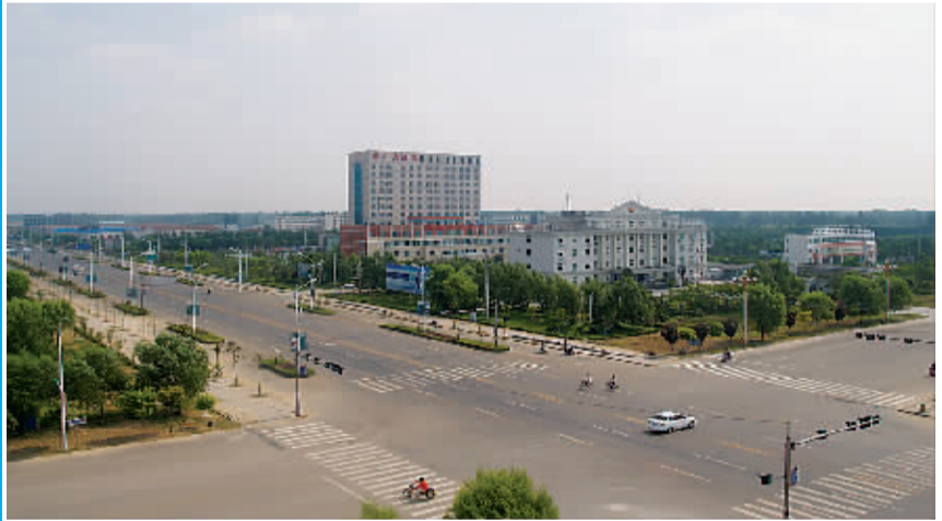
沈丘县宽阔整洁的兆丰大道和高耸的锦华大酒店。

享有“梁、宋、吴、楚之冲,齐、鲁、汴、洛之道”的沈丘县,以周朝的沈国为名,是豫东平原上一个古老而年轻的新兴县城。这是一片物阜民安,历经沧桑,深沉厚重、充满灵性的土地。翻开该县县志,观看其历史沿革,可知其早在秦朝的时候就已置县称为寝县,至今已有两千多年历史。隋开皇三年始建沈丘县,几经兴衰更迭,于