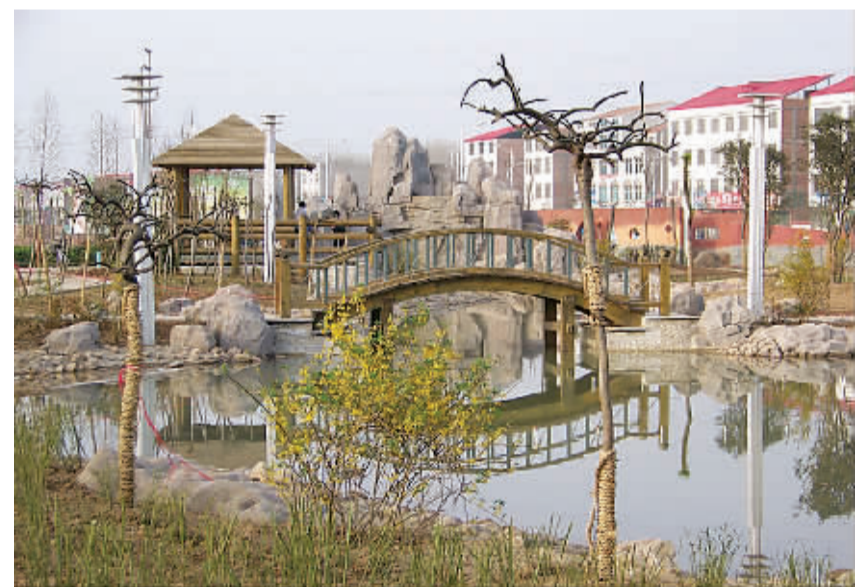
沈丘县造型别致的街心公园是市民休闲娱乐的好去处。