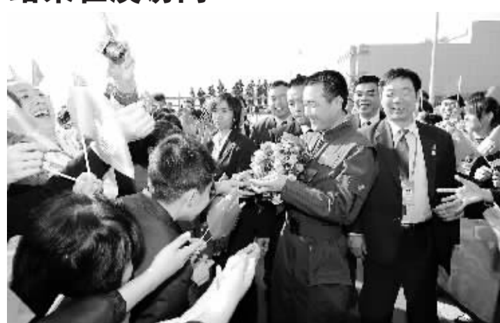
12月10日,神舟七号载人航天飞行代表团结束在澳门访问。这是航天员翟志刚在机场向送别群众赠送纪念徽章。