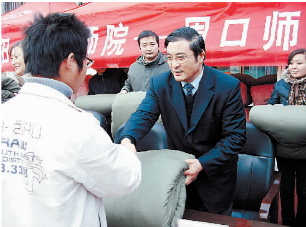
今冬,周口师院为各教学系1000余名家庭经济困难大学生发放过冬棉被。图为过冬棉被发放现场。据悉,本学期开学以来,周口师院通过国家助学金、贫困生助学金、助学贷款、勤工助学等方式加大对家庭经济困难学生的资助力度,确保贫困生在院校安心读书。