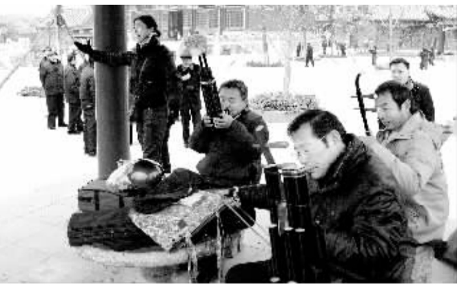
鹿邑县明道宫内,一群戏曲发烧友正聚在一起唱戏。据了解,鹿邑县城已自发形成了10余个民间组织,他们每星期至少组织一次活动,丰富了当地群众的业余生活。