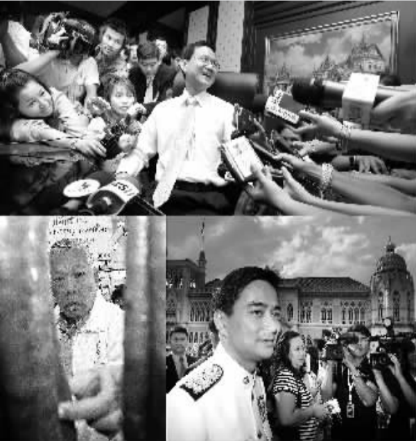
这是泰国前总理沙马(左下)、颂猜(上)和现任总理阿披实(右下)的拼版照片。9月份,沙马因“出任总理后主持烹饪电视节目违反宪法”被迫下台;12月份,颂猜政府因“人民力量党在去年底的选举中违规”倒台;12月15日,民主党主席阿披实当选泰国新一任总理。