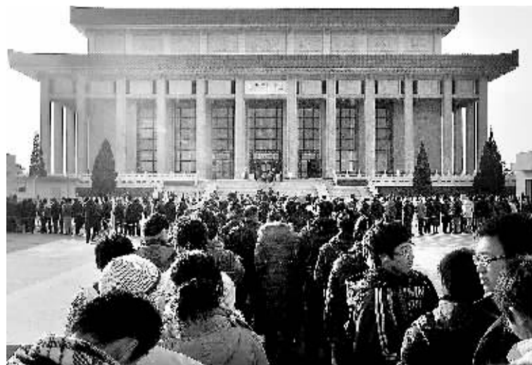
12月26日,来自各地的群众在北京毛主席纪念馆外排起长队。当日是毛泽东同志诞辰115周年纪念日。