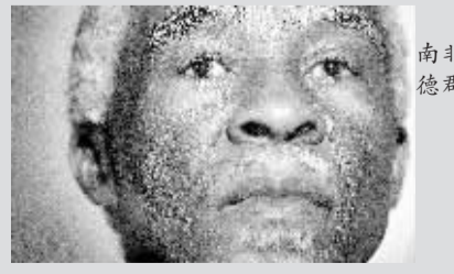
▲这是2008年4月5日南非总统姆贝基在英国赫特福德郡出席会议的资料照片。

2008年,国际政坛一如既往波谲云诡。从创造历史并为美国政治生态带来大裂变的首任非洲裔总统奥巴马,到烙有“普京印记”、延续“普京路线”、书写大国神话的梅德韦杰夫;从日本内阁一年之内两易其主,到泰国政坛走马灯似的总理“出炉”;从卡斯特罗