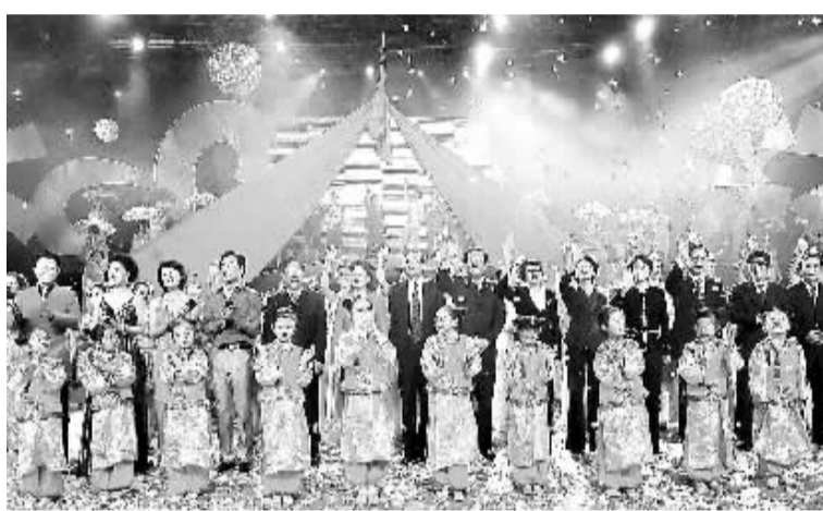
12月25日晚,颁奖礼现场获奖城市市长亮相。当晚,“2008中国最具幸福感城市”在昆明揭晓,杭州、宁波、昆明、天津、唐山、佛山、绍兴、长春、无锡、长沙10城市获此殊荣。其中杭州市因连续五年在调查推选活动中名列前茅而获得金奖。