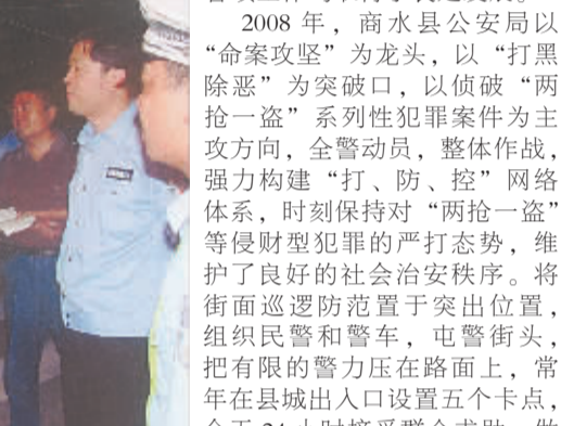
市委常委、政法委书记朱家臣在市长助理、市公安局局长姚天民的陪同下调研该县打击“两抢一盗”专项斗争开展情况。

●公安局 突出综合治理 提升群众安全感 “中心工作出亮点,单项工作创第一,全面工作上台阶。”近年来,商水县公安局党委紧紧围绕这一奋斗目标,坚持以科学发展观为统领,以加强自身建设为重点,以实施“六个一工程”为切入点,带领全局民警务实创新、开拓进取,各项工作均取得了长足发展。 2008年,商水县公安局以“命案攻坚”为龙头,以“打黑除恶”为突破口,以侦破“两抢一盗”系列性犯罪案件为主攻方向,全警动员,整体作战,强力构建“打、防、控”网络体系,时刻保持对“两抢一盗”等侵财型犯罪的严打态势,维护了良好的社会治安秩序。将街面巡逻防范置于突出位置,组织民警和警车,屯警街头,把有限的警力压在路面上,常年在县城出入口设置五个卡点,全天24小时接受群众求助,做到定点防防。90人的专职巡防大队采取徒步与机动车相结合的方式,定岗、定责、定人24小时全天候动态网格化巡逻,使县城居民白天见警车警察巡逻,夜间见警灯闪烁。全县设置50个卡点,民警分A、B两组,不定期启动卡点,盘查过往无牌无证车辆和盘查可疑人员,有力促进了农村群防群治工作的开展。