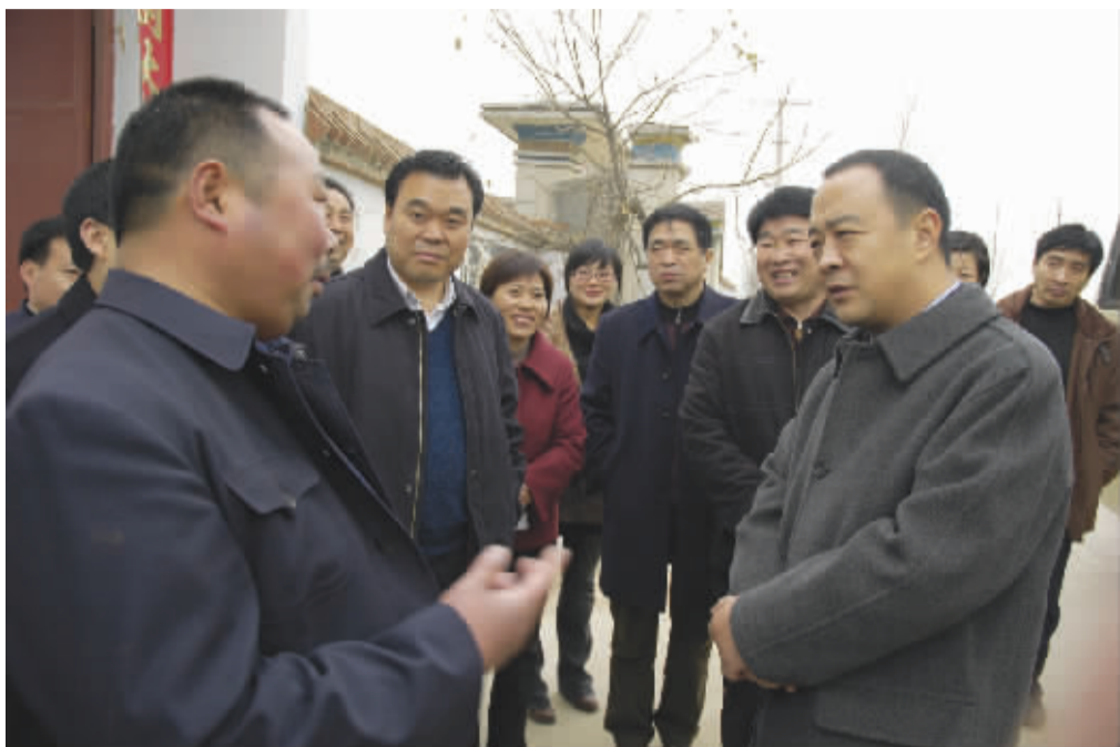
市委书记毛超峰在商水县委副书记张绍军陪同下调研该县平安建设