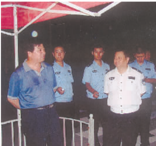
市委常委、政法委书记朱家臣在市长助理、市公安局局长姚天民的陪同下调研该县打击“两抢一盗”专项斗争开展情况。

●法院 发挥审判职能 全力维护社会和谐稳定 今年以来,商水县人民法院坚持以科学发展观为统领,坚持“党的事业至上、人民利益至上、宪法和法律至上”的指导思想,扎实开展“大学习、大讨论”活动,审判工作稳步推进,队伍形象得到改善,服务大局成效显著,工作机制逐步完善,各项工作呈现良好的发展态势。 充分发挥审判职能作用,努力化解各种社会矛盾和纠纷,全力促进社会的和谐与稳定。截至2008年11月中旬共受理各类诉讼案件1439件,审结1223件,结案率为85%。 弘扬“马锡五审判方式”,努力化解矛盾,实现案结事了。全面推行深入调查,不拘形式,就