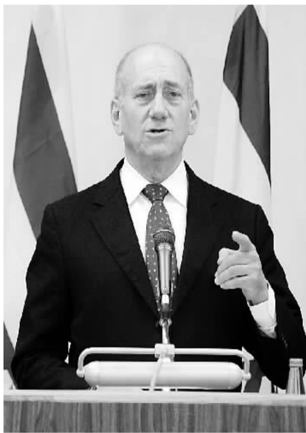
1月17日晚,以色列总理奥尔默特在特拉维夫参加安全内阁会议后举行新闻发布会,宣布在加沙地带实行单边停火。