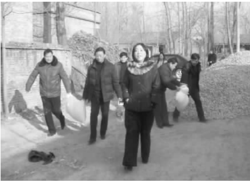
周口烟草行业慰问困难群众的情景。