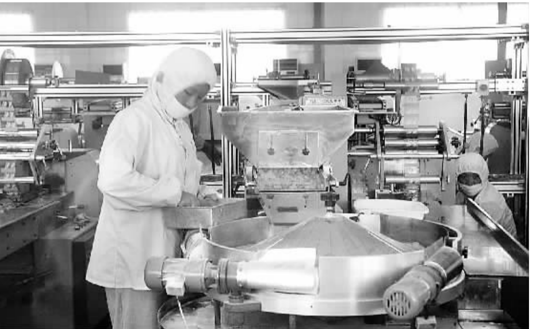
▼目前,全市的工业产业集群依托传统产业优势和大企业的强力带动,形成了相当的群体规模和协作效应,具备了较强的市场竞争力。图为春节前某食品加工企业正在加紧生产。