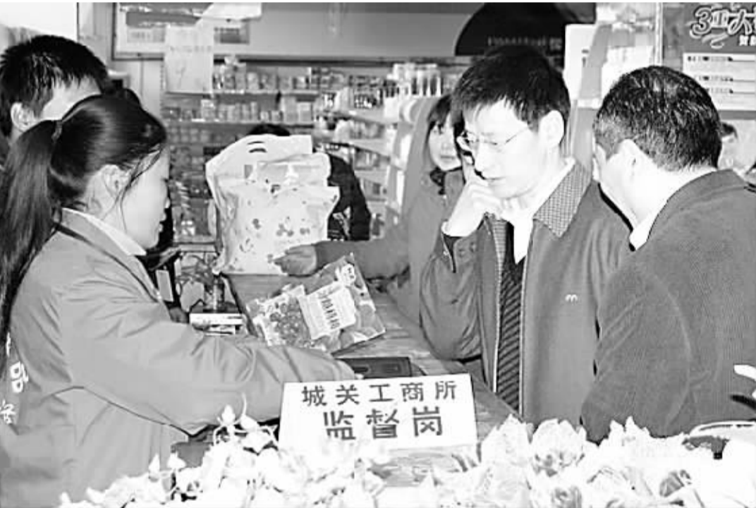
▲为了切实维护消费者的合法权益,商水工商局把监督岗设立在各个超市显著位置,及时收集分析消费方向和存在问题,及时受理消费者咨询和投诉,让消费者感到消费维权就在身边。(记者 沈湛 摄)

部门,采取多种形式,宣传少生孩子快致富是利国利民的大好事,宣传独生子女女户等计生和勤劳致富的典型事迹,宣传四大劳务品牌是农民致富的好门路,引导农民依托四大劳务品牌勤劳致富。同时,西华县委、县政府加大投入力度,对农民工进行培训,传经验教方法,增加四大劳务品牌就业人员。目前,该县四大劳务品牌从业人数达 15 万人,年创收 13 亿元。(彭世馨 刘发庆)