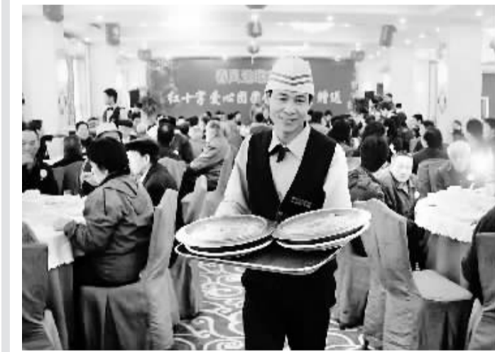
1月23日,困难家庭代表共享爱心团圆饭。当日,红十字爱心团圆饭暨年货赠送活动在福州举行。活动邀请低保线以下的特困家庭及2008年遭受重大灾害致贫的100个家庭代表共同吃一餐团圆饭,并向他们赠送爱心购物卡和年货。

技术制造,东亚国家和地区则提供设计、中间产品制造和全球销售,而中国主要是以劳动力要素参与东亚生产网络和国际分工体系。