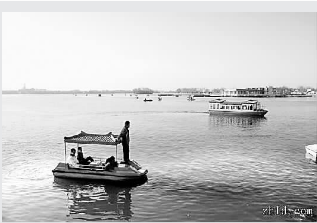
▲网友“黑蝴蝶”:大年初一,龙湖泛舟。