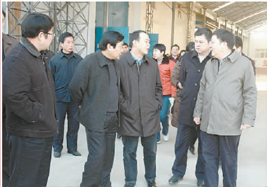
市委书记毛超峰、市长徐光一行到该公司调研