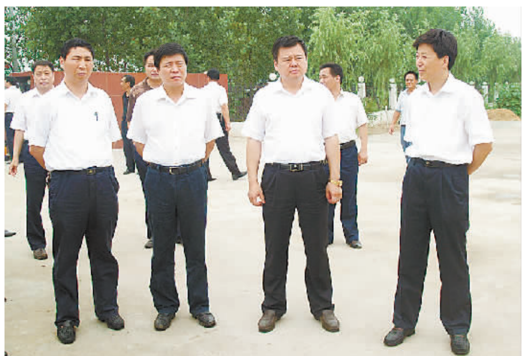
市长徐光、副市长史根治在沈丘县委书记王云彪、县长杨永志的陪同下视察沈丘工业园区建设

沈丘县位于豫皖交界处,居颍水中游,占地利之优势,得交通之便利,享物产之丰富,是周口市东大门,也是豫东南和皖西北交流的重要门户和物资集散地。全县辖10镇11乡,总人口121.26万人,总面积1080.53平方公里。沈丘县历史悠久,文化灿烂,境内有乳香台、冢子胡、清真古寺、青固堆、东冢等文化古迹。