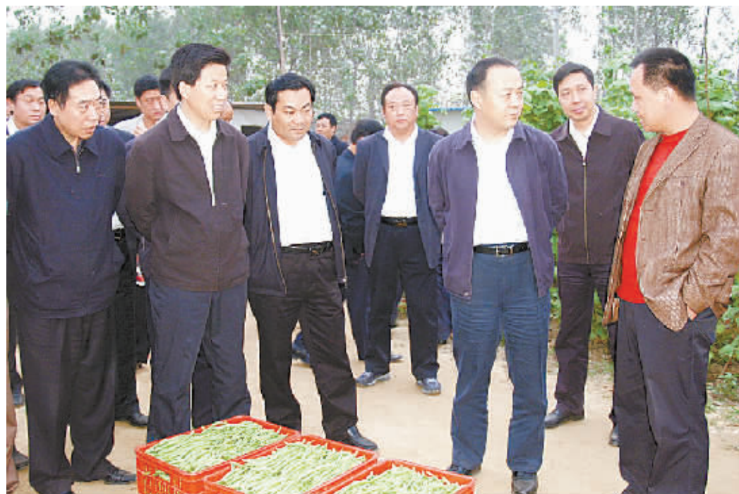
市委书记毛超峰在沈丘县委书记王云彪的陪同下调研沈丘农民落实土地流转政策、开展蔬菜大棚种植情况