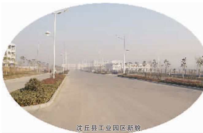
沈丘县工业园区新貌