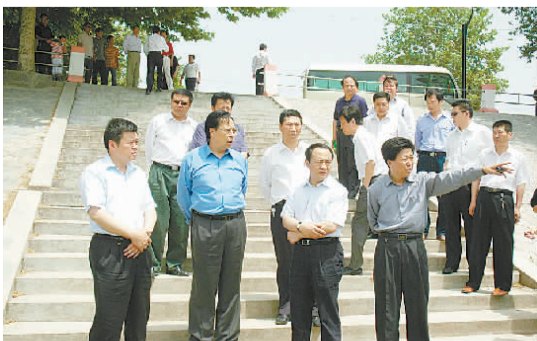
省委书记徐光春在市委书记毛超峰、市长徐光、沈丘县委书记王云彪、县长杨永志的陪同下视察沙河河改造工作