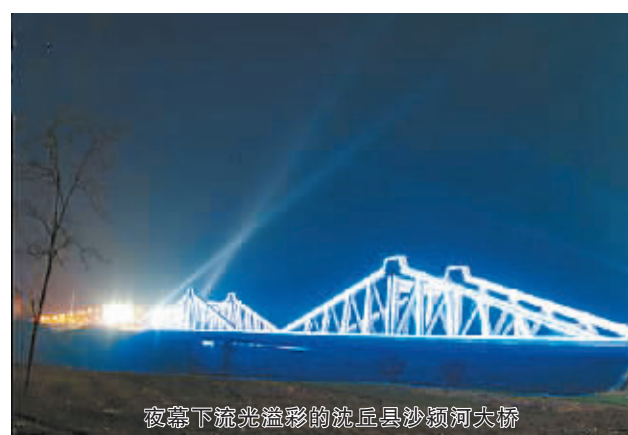
夜幕下流光溢彩的沈丘县沙河河大桥

——加强社会管理,着力抓好社会和谐稳定。受金融危机和国内经济发展形势的影响,各种矛盾会更加复杂多变,维护社会和谐稳定的任务会更加艰巨。要进一步加强矛盾纠纷的排查化解力度,重源头、抓苗头、强基层、打基础,最大限度减少不和谐不稳定因素。要高度重视和加强信访工作,认真落实书记、县长大接访和领导干部信访接待日制度,严格落实维稳领导责任制和责任追究制,有效防止和妥善处置群体性事件,把矛盾化解在基层,把问题解决在萌芽状态。要强化安全生产,牢固树立安全发展理念,坚决防止重特大安全事故,确保人民群众生命财产安全。深入推进平安沈丘建设。