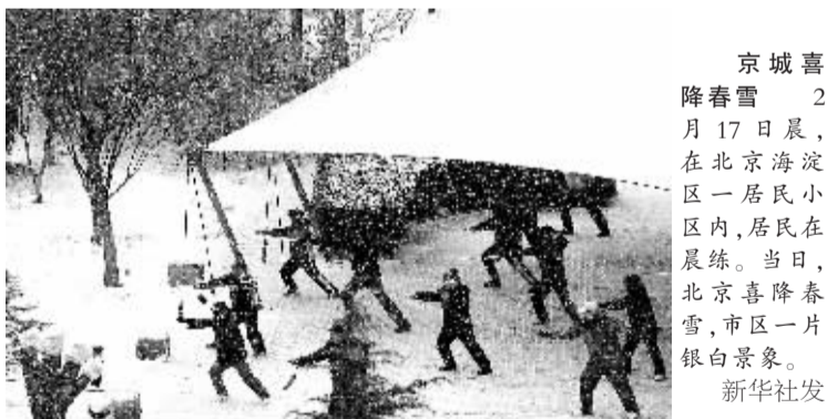
京城喜降春雪 2月17日晨,在北京海淀区一居民小区内,居民在晨练。当日,北京喜降春雪,市区一片银白景象。

据悉,2008年,我国汽车整车出口取得突出成绩的企业(含集团)包括奇瑞汽车有限公司、本田汽车(中国)有限公司,中国重型汽车集团有限公司、长城汽车股份有限公司、中国第一汽车集团进出口公司、金龙联合汽车工业(苏州)有限公司等。