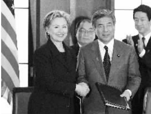
美日签署驻冲绳美国海军陆战队迁移至关岛协定 2月17日,在日本首都东京,到访的美国国务卿希拉里(前左)与日本外相中曾根弘文(前右)共同签署驻冲绳美国海军陆战队迁移至关岛的协定。此协定将加快驻日美军的整编进程。

澳大利亚总理陆克文和维多利亚州州长布伦比16日在一份联合声明中说,本月22日将是悼念大火遇难者的全国哀悼日,届时将在维州首府墨尔本举行悼念活动。