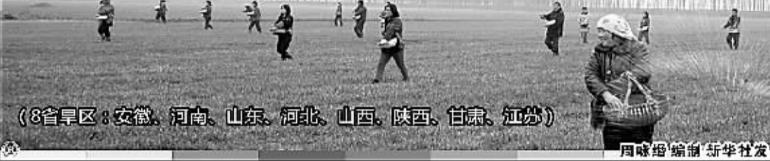
(8省旱区:安徽、河南、山东、河北、山西、陕西、甘肃、江苏)