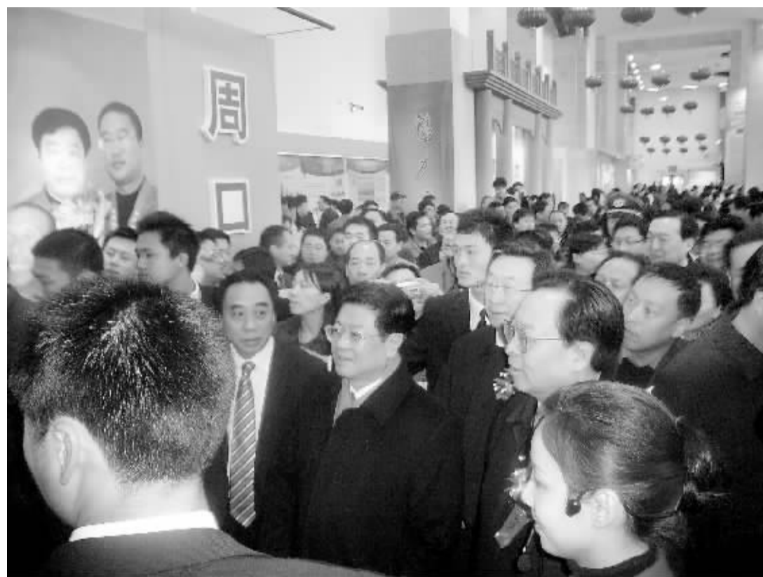
“河南农民工风采展”期间,3月2日上午,中共中央政治局委员、全国人大常委会副委员长、中华全国总工会主席王兆国,全国政协副主席郑万通,在省委书记、省人大常委会主任徐光春,省委副书记、省长郭庚茂等陪同下到周口展区参观。

2008年,周口籍农民工李高峰被评为“首都劳动模范”、还被北京奥组委评为“优秀志愿者”。