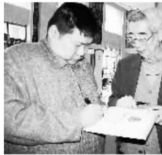
毛新宇和周海婴的邂逅 3月11日,全国政协委员、毛泽东之孙毛新宇(左)和全国政协委员、鲁迅之子周海婴委员在驻地邂逅。这是周海婴拿出两会纪念邮品,让毛新宇在封面上签名留念。

陈云英认为,社区教育学院的性质应是非赢利的资格证书教育,在保证教育质量的同时,将学生的学费负担减到成本水平。社区教育学院的课程设置则以实用的职业技术教育为主,如软件开发、美容、家电维修、汽车维修等。