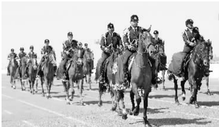
科威特举行国庆阅兵式 3月11日,在科威特首都科威特城举行的阅兵式上,骑兵经过主席台。当天,科威特举行阅兵式,庆祝建国48周年。

“医师无国界协会”成立于1971年12月20日,总部设在比利时首都布鲁塞尔,是全球最大的独立人道医疗救援组织。