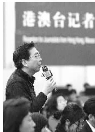
文化部有关负责人接受专题采访 3月12日,十一届全国人大二次会议新闻中心举行“文化市场与文化产业”专题采访,文化部有关负责人在新闻中心接受中外记者的采访。这是一位来自台湾的记者在提问。