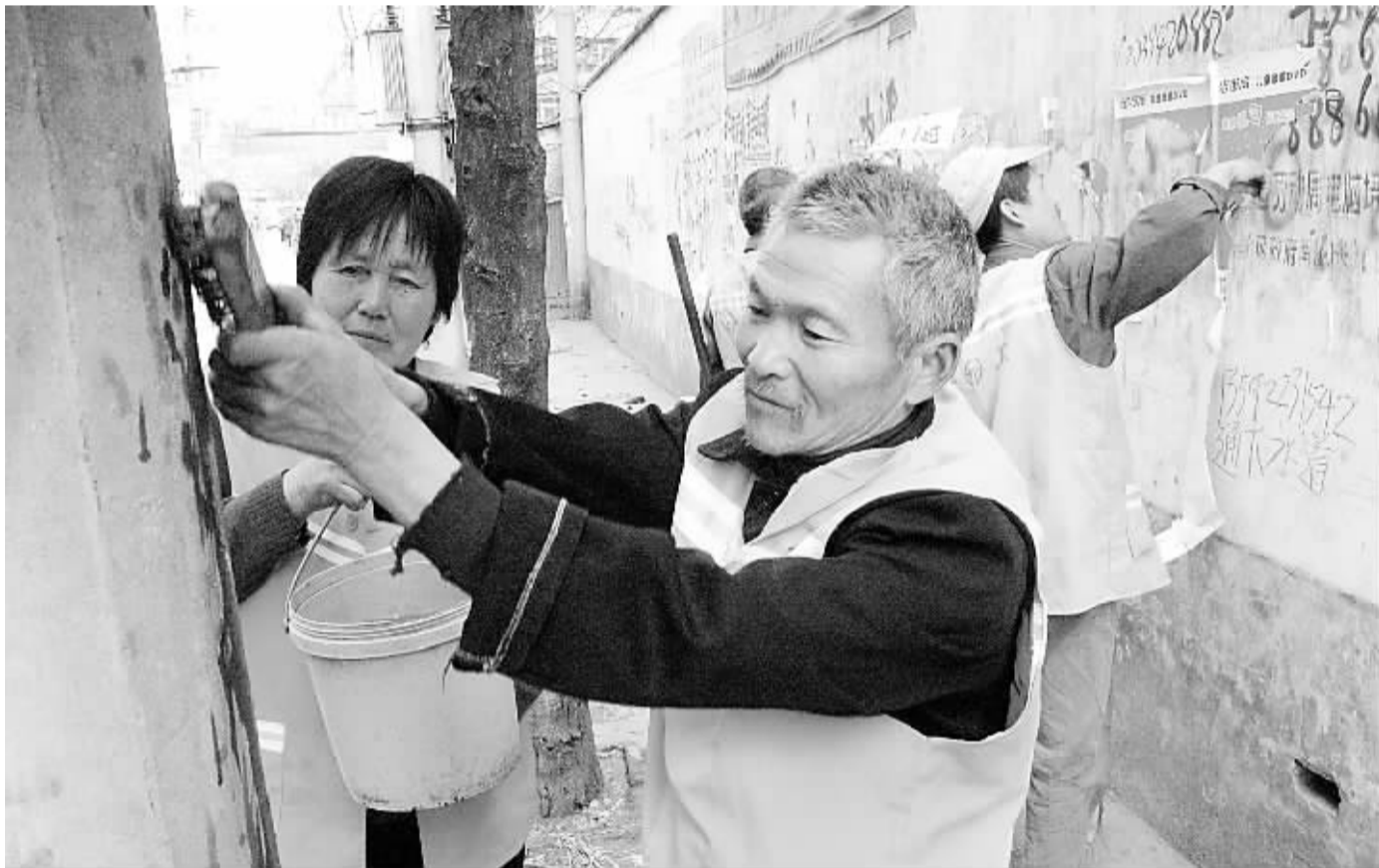
今年4月是全国第21个爱国卫生月。为迎接爱国卫生月的到来,川汇区爱卫会300多名干部职工全员出动,发起集中清理辖区垃圾死角和牛皮癣的卫生整治风暴活动。截至目前,他们共清理垃圾死角40多处,清运垃圾600多立方米,清除牛皮癣20000多处。 线索提供 刘军霞