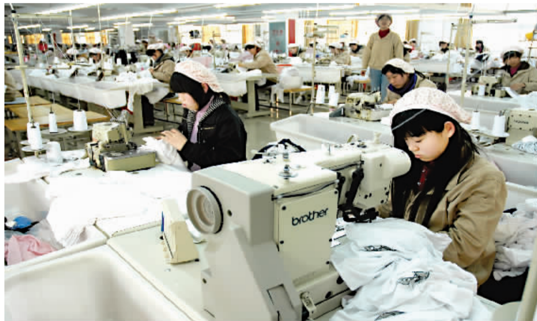
项城市在实现工业经济产业结构的优化升级过程中,紧紧抓住凸显周口优势的食品加工、医药化工、纺织服装三大支柱产业,培育壮大重点企业和骨干企业。图为项城市欧柏莱服装加工厂生产车间。

科学发展观内涵丰富、博大精深。要把把握科学发展观的真谛,就必须老实地学、刻苦地学、反复地学,那种以为可以一蹴而就、寄希望于毕其功于一役的想法,那种浅尝辄止、满足于形式主义、一知半解的做法,都要尽力防止。全市广大党员干部一定要进一步提高认识、端正态度、摆正位置,以更加高昂的精神和更为扎实的作风投入到学习中去。