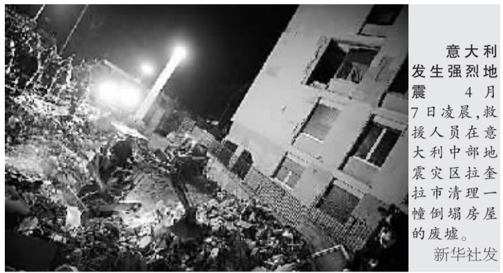
意大利发生强烈地震 4月7日凌晨,救援人员在意大利中部地震灾区拉奎拉市清理一幢倒塌房屋的废墟。

新华社北京4月7日电 国家主席胡锦涛7日就意大利阿布鲁佐大区发生严重地震灾害,造成重大人员伤亡和财产损失,向意大利总统纳波利塔诺致慰问电。 胡锦涛代表中国政府和人民并以个人名义,向纳波利塔诺总统并通过他向灾区人民和遇难者亲属致以诚挚慰问,对遇难者表示沉痛哀悼。胡锦涛表示相信,在纳波利塔诺总统和意大利政府的领导下,意大利人民一定能够克服困难,早日恢复灾区正常生产生活秩序,重建美好家园。 同日,吴邦国委员长、温家宝总理分别向意大利参议长斯基法尼、众议长菲尼和总理贝卢斯科尼致慰问电。