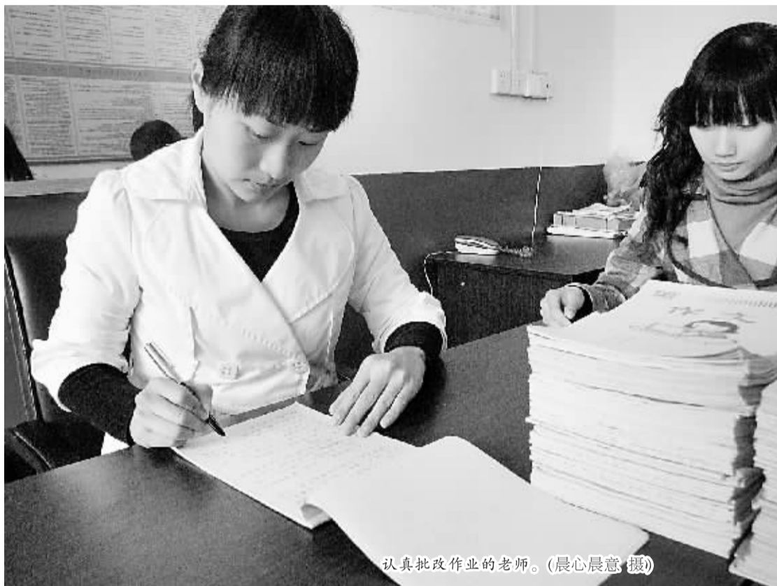
认真批改作业的老师。

真言针语:我们做老师的,有时候有点“贱皮”,我就是这样,一到课堂上,所有的都忘了,生怕学生学不会!工作这几年,我一大老爷们,都快成“老太婆”了!面对社会上对我们的诋毁,我觉得,我们能做的就是对得起个人良心就可以了!