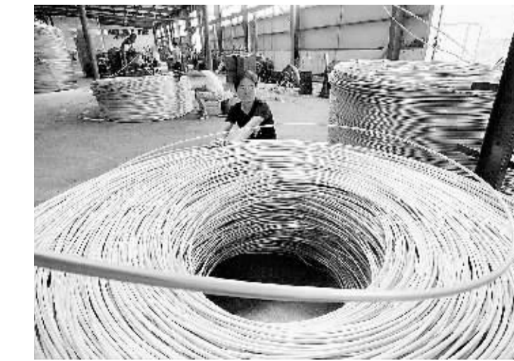
市经济开发区良好的环境和政策,吸引了各方客商在此落户。他们积极帮助企业改革、改组、改造,使部分企业发展成为具有参与国际竞争能力的大型企业集团。图为市经济开发区电缆工业园区生产车间一角。

响发展环境、阻碍经济发展的重点问题进行有效的监督检查,特别是对该办不办、推诿扯皮、办事拖拉、官僚主义等不作为行为,以及超越职权、滥用职权等乱作为行为,要进行重点查办,严肃处理。同时,该县进一步加大对各种危害经济发展环境案件的查处和惩戒力度,特别是对在行政审批工作中搞违规、越权及超时审批,甚至借机吃拿卡要的;在政务公开中搞假公开、假承诺以至引起企业和群众强烈不满的;在招商引资工作中失职、渎职的;以及其他阻碍政令畅通、损害服务对象合法权益等各种行为都要按规定严厉查处。纪检监察机关要把优化经济发展环境各项工作做实做细,并且作为一项经常性的工作长期开展下去。 (徐汝涛 吕兵鸣)