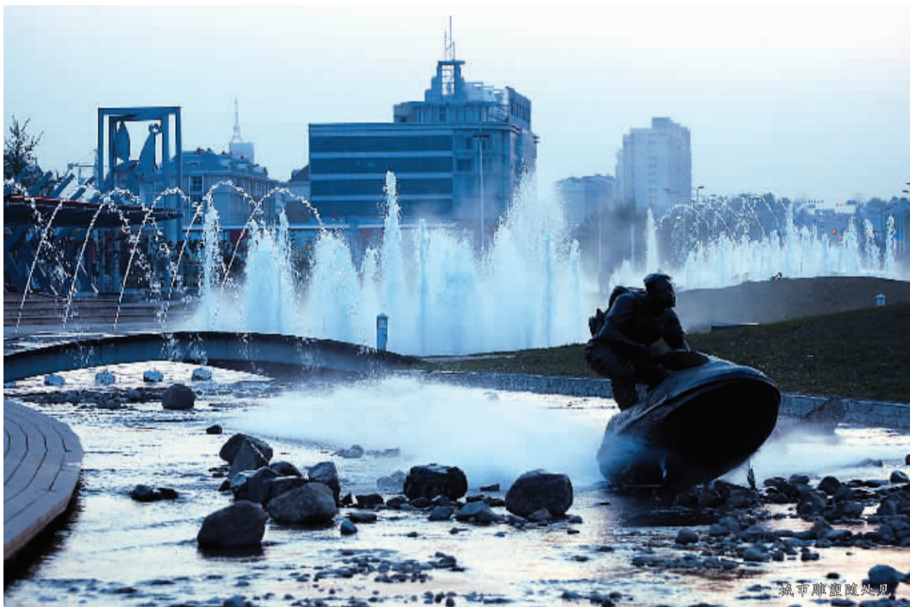
城市雕塑随处可见