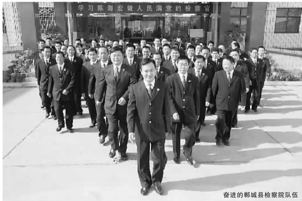
奋进的郸城县检察院队伍

当年,郸城县检察院共受理提请批准逮捕各类刑事犯罪嫌疑人221人,依法批准逮捕214人;受理移送审查起诉208人,依法提起公诉203人,批捕、起诉准确率达到100%;立案查处职务