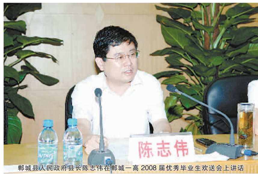
郸城县人民政府县长陈志伟在郸城一高2008届优秀毕业生欢送会上讲话

郸城一高的这种“1+1”的工作举措,一方面能够方便学校各部门进行工作配合,为各部门及时了解相互之间的工作动态,提高工作效率,促进工作开展提供了平台;另一方面能够方便学校对整体工作进行合理的统筹安排,使学校及时掌握各部门的工作计划、工作进程和工作开展情况,确保各项工作的更加协调,为“二次创业”提供了前进的动力!