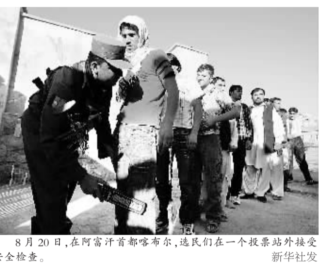
8月20日,在阿富汗首都喀布尔,选民们在一个投票站外接受安全检查。

据新华社喀布尔8月20日电(记者颜亮 林晶)阿富汗总统选举和省议会选举20日在严密的安保措施下举行,这是2001年塔利班政权被推翻后阿富汗第二次举行全国大选。