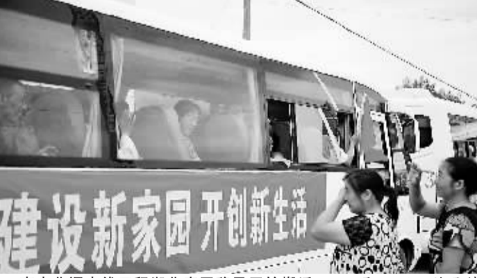
南水北调中线工程湖北库区移民开始搬迁 8月20日,均县镇关门岩村的移民乘车前往安置点。当日,湖北省丹江口市均县镇和习家店镇移民开始搬迁,南水北调中线工程湖北库区首批移民搬迁由此启动。