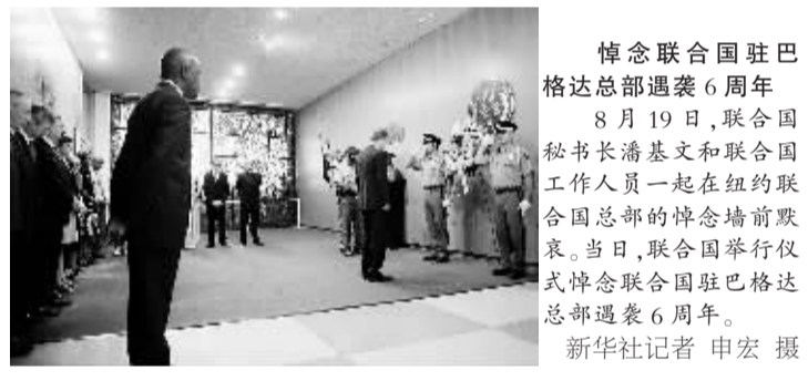
悼念联合国驻巴格达总部遇袭6周年 8月19日,联合国秘书长潘基文和联合国工作人员一起在纽约联合国总部的悼念墙前默哀。当日,联合国举行仪式悼念联合国驻巴格达总部遇袭6周年。

据新华社马来西亚波德森港8月20日电(记者熊平 李雪青)马来西亚海事执法机构搜救部门负责人陈国述20日说,马来西亚有关方面还在继续搜救9名失踪的中国大陆船员,但目前仍无失踪船员下落。