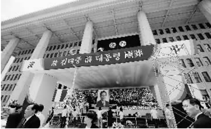
8月20日,在韩国首都首尔,工作人员在国会前布置悼念已故总统金大中的国家灵堂。

此前仅在1979年为在任期内遇刺身亡的朴正熙总统举行过国葬。金大中因患肺炎于7月13日住院接受治疗,中间病情有所反复,终因病情加重医治无效,于8月18日下午去世,享年85岁。