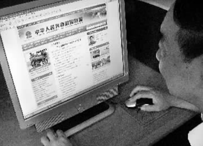
中华人民共和国国防网上线试运行 8月20日,一名上海市民浏览上线试运行的中华人民共和国国防网网站。经中央军委批准,中华人民共和国国防网网站20日上线试运行,其域名为www.mod.gov.cn,目前开通中、英文两种版本。

到选举投票前48小时。在首轮投票中,获得全部选票50%以上的候选人将赢得总统选举。