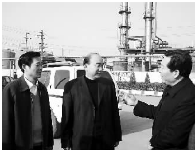
副省长史济春(右)在郸城县委书记刘占方(左)的陪同下,到财鑫集团调研,向件树仁(中)详细了解企业生产经营情况,对财鑫发展给予高度评价。