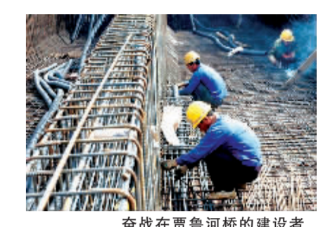
奋战在贾鲁河桥的建设者