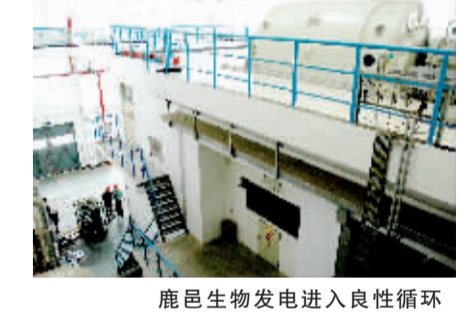
鹿邑生物发电进入良性循环

总策划：杨斌红 叶楠 郭其健 策划：孙智 魏东 王豫郑 执行：王豫郑 滕永生