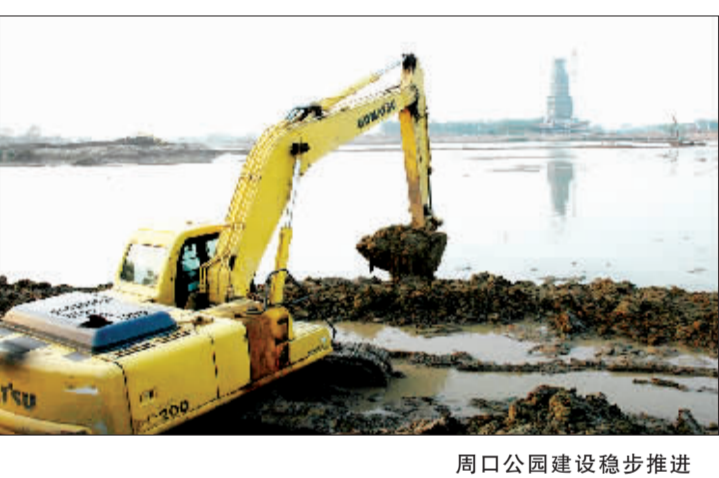
周口公园建设稳步推进