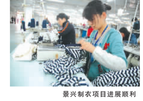
振兴制衣项目进展顺利