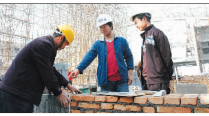
忙碌在重点工程的监理人员