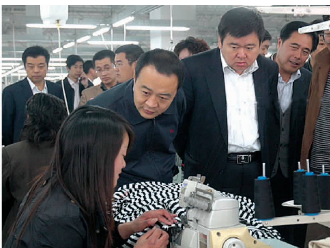
市委书记毛超峰、市长徐光深入企业调研