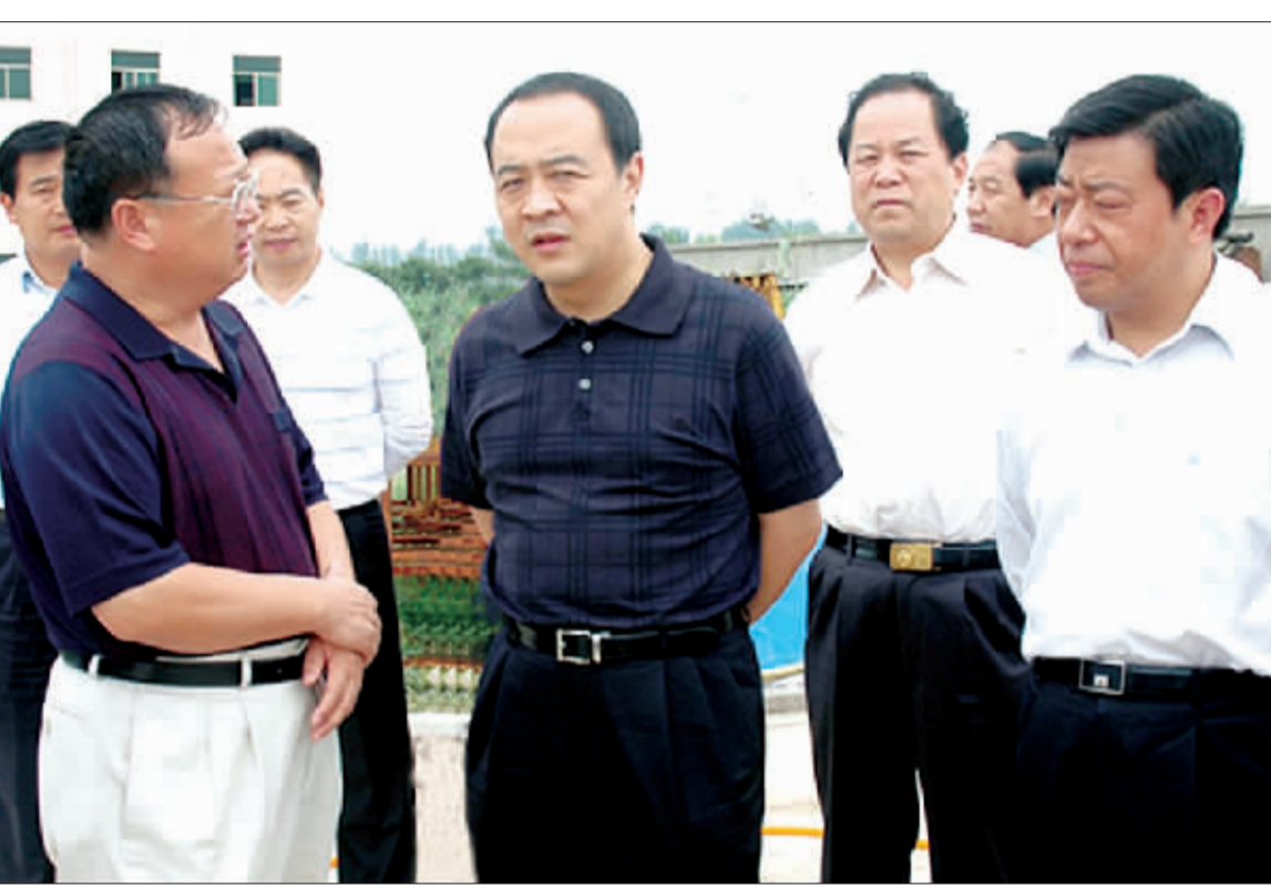
市委书记毛超峰到重点工程现场指导工作