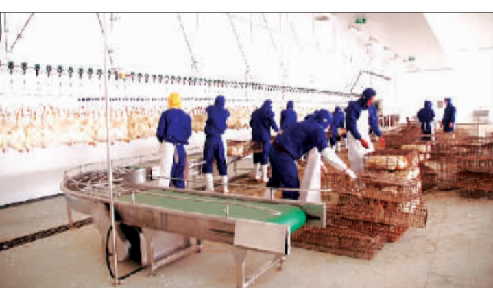
华肉类鸡系列加工项目