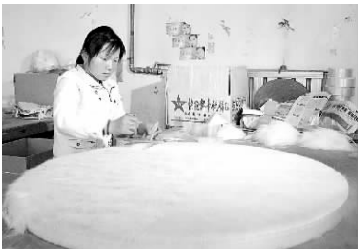
被誉为“中国尾毛之乡”的鹿邑县张店乡,抓住尾毛产业复苏的有利时机,积极培训、安置返乡农民工、富余劳力进厂务工或走“公司加农户”的合作生产模式,以品质高、信用好赢得了新商机,该乡新接到订单2000余万元。图为张店乡胜利尾毛制品厂员工在从事羊毛梳理工序。

财产安全,还是贯彻落实科学发展观的具体实践,要求全体驻村干部、第二批“千人驻村”队员、大学生村干部和村“两委”干部,通过运用“四议两公开”工作方法,动员在家劳力迅速行动起来,对受灾家庭进行帮扶,对道路进行清理,对树木和牲畜进行防寒保护。(刘天义 范华)