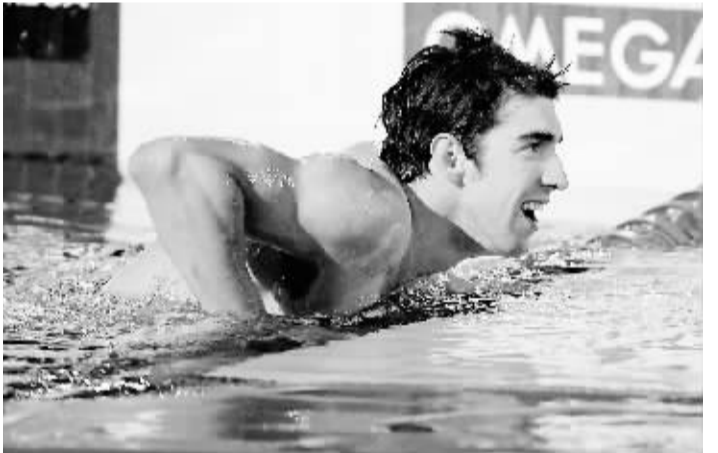
12月19日,美国队选手菲尔普斯在比赛后笑容灿烂。当日,在英国曼彻斯特进行的“池中对决”游泳挑战赛男子4X100自由泳接力比赛中,美国队以3分03秒30的成绩获得冠军并打破该项目世界纪录。

这样,中国自由式滑雪队在世界杯首日比赛中不仅夺得首金,还获得了全部6枚奖牌中的5枚,为温哥华冬奥会前的备战开了个好头。20日,本赛季世界杯将在长春进行第二站的争夺。