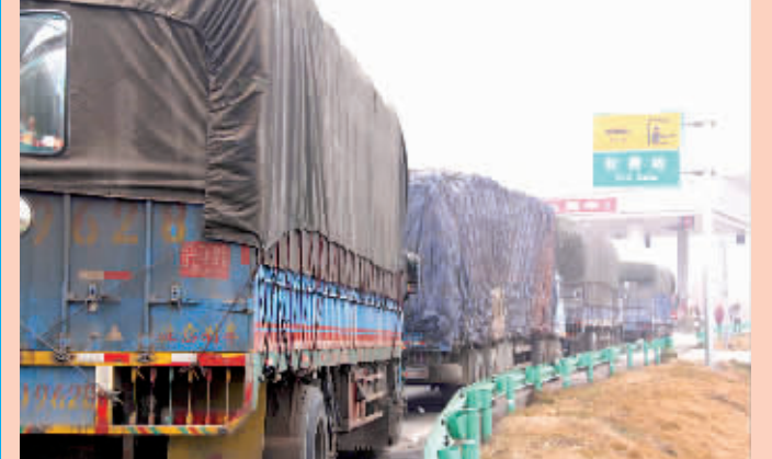
1 月 4 日,车辆在江西宜春昌金高速入口处排起长龙。1 月 4 日晨,江西省气象台发布大雾橙色预警信号。受大雾影响,当地多条高速公路封闭,造成部分车辆滞留。