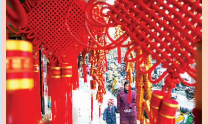
1 月 4 日,两名路人从一商铺悬挂的节日饰品前经过。随着春节临近,合肥市场上中国结、红灯笼、对联、生肖虎贴等节日饰品热销。