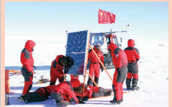
1 月 2 日以来,肆虐的暴风使中国南极内陆格罗夫山考察队被困营地。利用暴风趋缓的间隙,考察队 1 月 4 日在营地附近成功安装一台地震观测站。这是中国首次在南极内陆格罗夫山地区部署地震观测站。